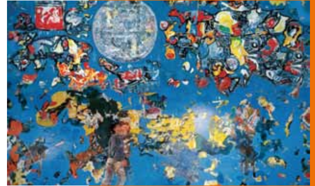
Kiro Urdin - Planetarium ('Planetarisme')