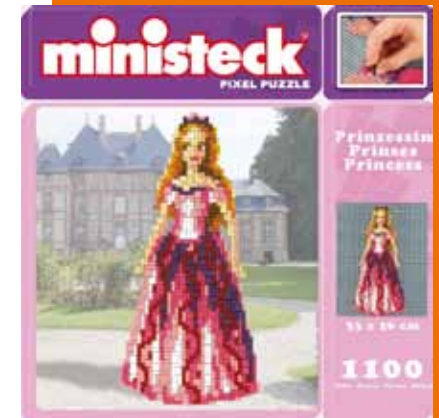
Ministeck - Pixel Puzzle