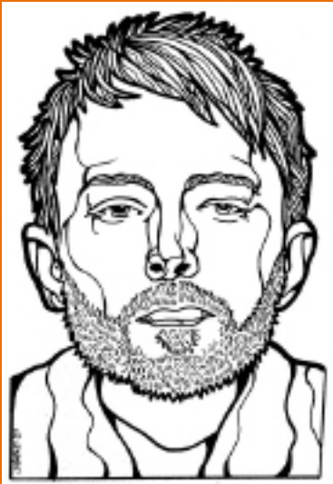
Sam Morrison - Thom Yorke Line Art Drawing (2009)

digitale technologie. Vroeger noemde men deze kunstvorm ook wel "Computer gegenereerde kunst" of "Multimedia kunst"), - Line-art (Meestal eenkleurige tekeningen (zoals met een pen of een potlood) met kleine of niet-vaste gebieden, en geen schaduw effect).