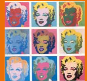
Andy Warhol - Marilyn Monroe (Business-art)