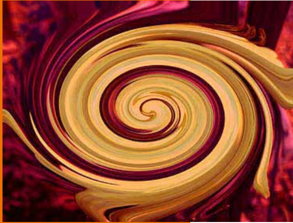
Onbekend - Nb 2004/0080, 3264 x 2448 px (Digitale kunst)