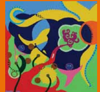
AMUKEK - Let the Dark Clouds Disappear (2010); 100 x 100 cm, acryl op doek